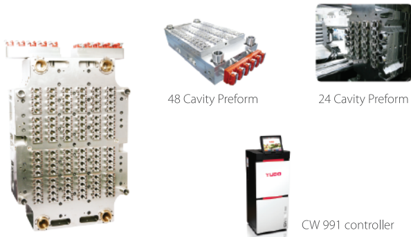
48 Cavity Preform